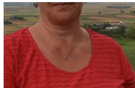
UN JOUR, UN SOUVENIR - LA ...