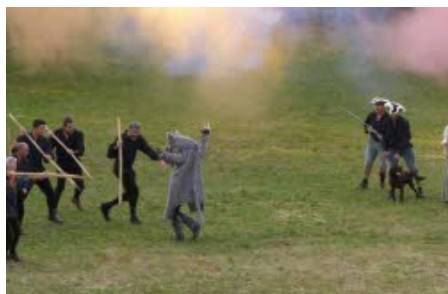
LOCALE EXPRESS - LA CÔTE- SAINT-ANDRÉ