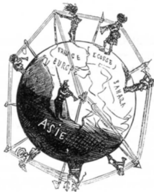
M. Berlioz profitant de son bâton électrique pour diriger un orchestre qui aura ses exécutans dans toutes les régions du globe.