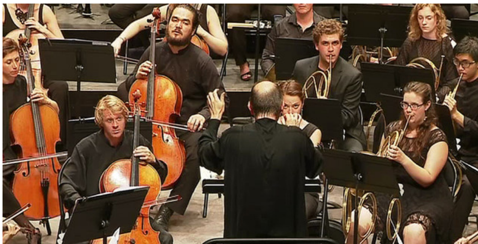
François- Xavier Roth dirige le Requiem de Berlioz

Mis à jour le 23/08/2018 à 18H42, publié le 23/08/2018 à 15H18