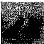
CD KLASSIEK Reich WTC 9/11 Nonesuch