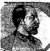
CD KLASSIEK Saint-Saëns Orgelsymfonie Actes Sud