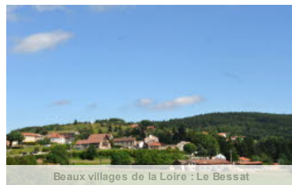
Beaux villages de la Loire : Le Bessat