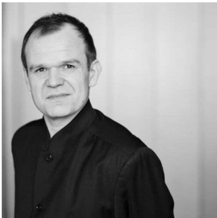
François Xavier Roth

C'est en quelque sorte une gageure que de programmer une oeuvre colossale comme le Te Deum de Berlioz et ses effectifs hors normes dans une salle de concert : c'est pourtant un pari que François-Xavier Roth a relevé et gagné brillamment ce 20 juin à la Philharmonie de Paris, dans le cadre d'un week-end dédié aux pratiques amateurs.