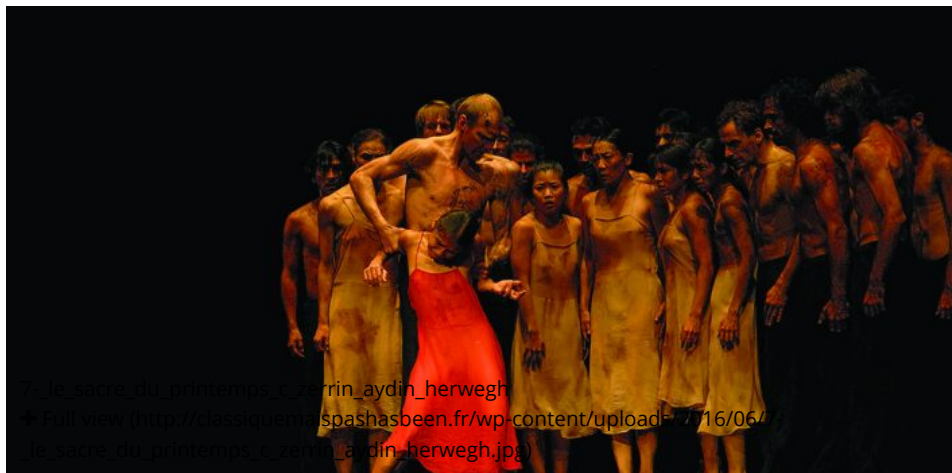
Les Siècles du printemps - herwin_aydin_herwegh Full view ( http://classiquemaishasbeen.fr/wp-content/uploads/2016/06/les-siecles-du-printemps-herwin_aydin_herwegh.jpg )

Les Siècles et la troupe de Pina Bausch à Nîmes