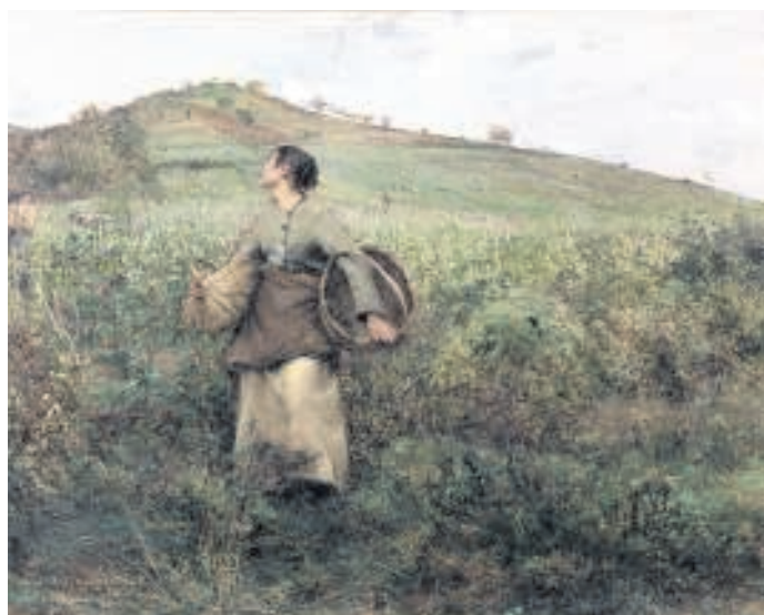
Jules Bastien-Lepage, De Druivenoogst, 81,3 x 105,4 cm, olieverf op doek, 1880.