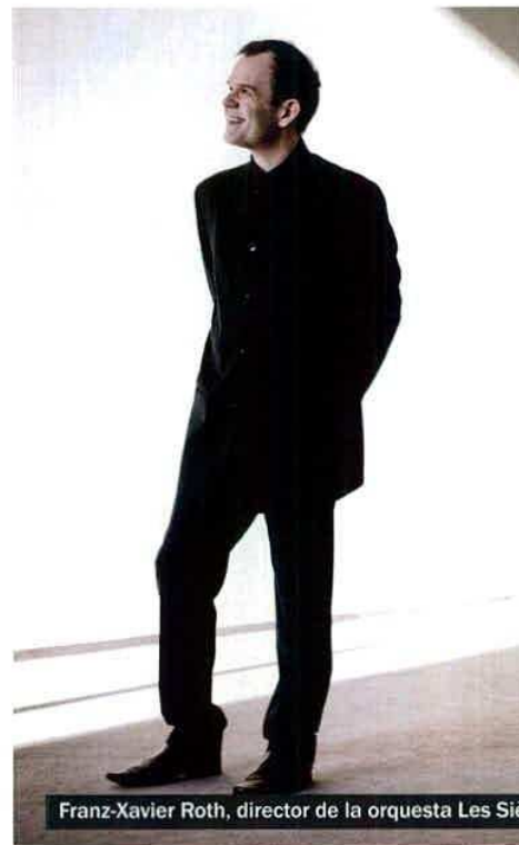
Franz-Xavier Roth, director de la orquesta Les Siècles

Tendremos también la riqueza del repertorio colombiano con el Colectivo Colombiano, Monsieur Periné y Jorge Velosa y los carrangueros de Ráquira. Música para todos los gustos en la edición Símbolo y sonido en Cartagena para iniciar el 2017 y también para celebrar por el comienzo oficial del Año Francia-Colombia, que tendrá innumerables eventos organizados entre los dos países.®