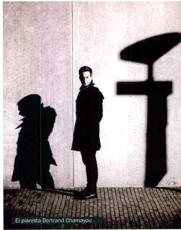
El pianista Bertrand Chamayou