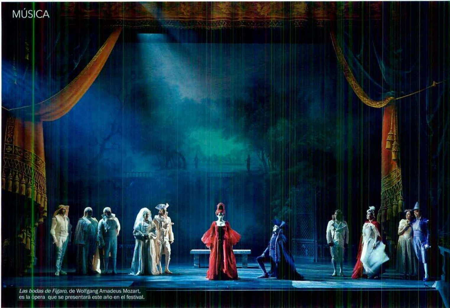
Las bodas de Figaro, de Wolfgang Amadeus Mozart, es la ópera que se presentará este año en el festival.