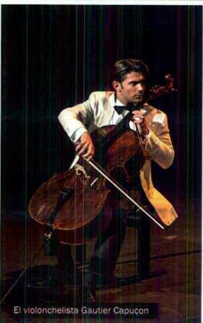
El violonchelista Gautier Capuçon

A través de obras orquestales, para piano y de cámara (incluido el repertorio vocal), los espectadores podrán acercarse a esa particular sonoridad francesa. Y como es habitual, el festival ha buscado artistas que son verdaderos especialistas en el tema. La orquesta residente es Les Siècles, la cual utiliza instrumentos históricos, algo complejo cuando en el repertorio de un mismo concierto hay obras de diferentes épocas. La orquesta estará dirigida por su fundador, Franz-Xavier Roth, un carismático director que domina el repertorio desde el barroco hasta nuestros días. Por eso es invitado frecuente de las grandes orquestas del mundo. Roth conoce y disfruta enormemente de la música francesa, que lleva en la sangre.