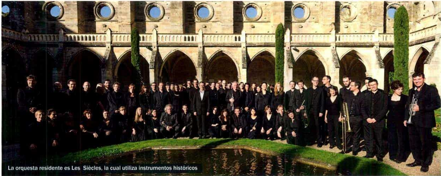
La orquesta residente es Les Siècles, la cual utiliza instrumentos históricos

ha dedicado un recital de su música para piano y un concierto de música de cámara con el objetivo de acercarse un poco más a sus particulares estilos. Como complemento, un recital de pianistas que vivieron en torno de ellos, otro concierto de obras de cámara de la época y dos más dedicados al repertorio vocal. Por un lado, canción francesa, y por otro, ópera comique , las cuales ponen de manifiesto la cercanía con la literatura simbolista.