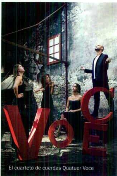
El cuarteto de cuerdas Quatuor Voce