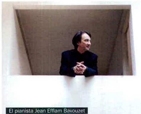
El pianista Jean Efflam Bavouzet