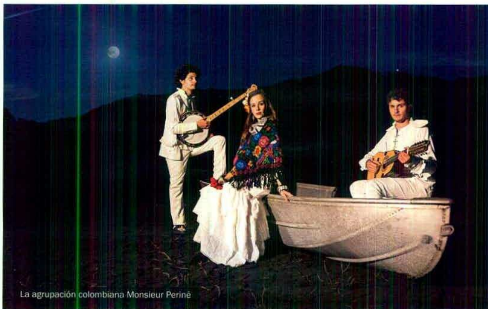
La agrupación colombiana Monsieur Periné