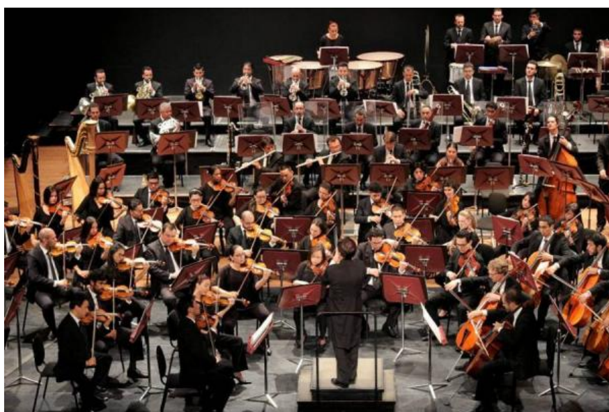
La Orquesta Sinfónica de Colombia tendrá su primer núcleo del Proyecto Social en escena.

Del 6 al 16 de enero, sonará en la Ciudad Amurallada la edición 11, con el eje 'París y la música francesa de principios de 1900'.