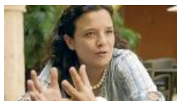
Arrancó la fiesta cultural en el Hay Festival 2016 en Cartagena