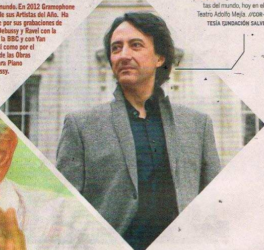
JEAN-EFFLAM BAVOUZET, UNO DE los grandes pianistas del mundo, hoy en el Teatro Adolfo Mejía.

Uno de los grandes pianistas del mundo. En 2012 Gramophone nombró a Bavouzet como uno de sus Artistas del Año. Ha ganado premios Gramophone por sus grabaciones de las obras de concierto de Debussy y Ravel con la Orquesta Sinfónica de la BBC y con Yan Pascal Tortelier, así como por el cuarto volumen de las Obras Completas para Piano de Debussy.