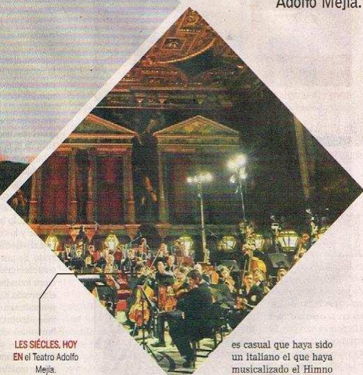
LES SIÈCLES, HOY EN el Teatro Adolfo Mejía.