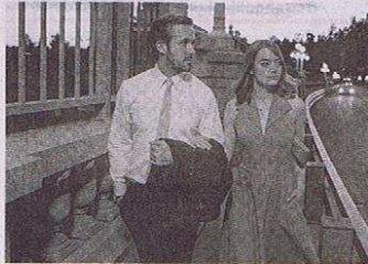
HOY en la Cinemateca del Caribe se presentará el largometraje 'La la land'. Una historia que retrata a dos soñadores que luchan por sus sueños en una ciudad conocida por destruir esperanzas.