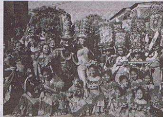
HOY se izarán las banderas de las agrupaciones: Congo Palmareño, Congo Dinastía, Comparsa Experiencia de Villate, Pequeños danzarines, Congo Bantú, y el Congo reformado.