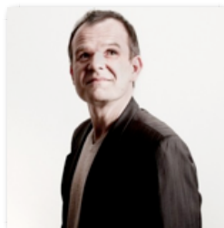
François Xavier Roth